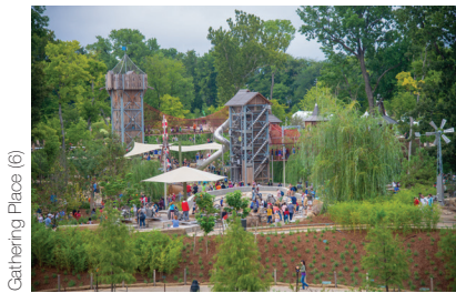
Gathering Place (6)