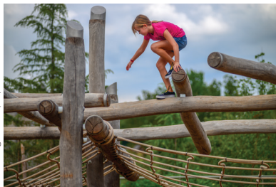
Gathering Place (31)