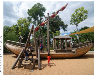
Gathering Place (29)