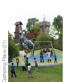
Gathering Place (21)