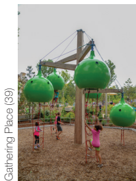
Gathering Place (39)