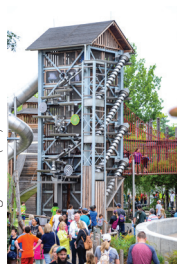
Gathering Place (40)