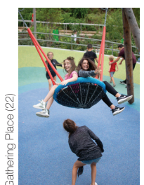
Gathering Place (22)