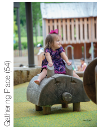
Gathering Place (54)

Text-Nachdruck kostenfrei, bitte mit Nennung des Herstellers. Vielen Dank für einen Veröffentlichungsbeleg.