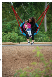
Gathering Place (15)