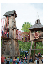
Gathering Place (17)