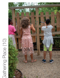
Gathering Place (10)