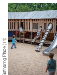
Gathering Place (14)