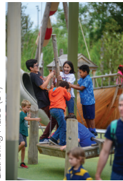
Gathering Place (51)