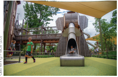
Gathering Place (28)