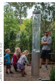
Gathering Place (8)