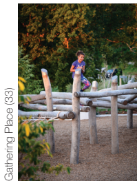
Gathering Place (33)