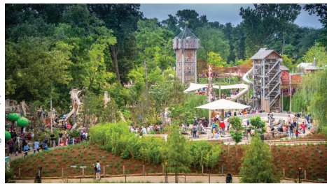
Gathering Place (5)