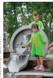
Gathering Place (41)