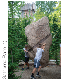
Gathering Place (1)

Text-Nachdruck kostenfrei, bitte mit Nennung des Herstellers. Vielen Dank für einen Veröffentlichungsbeleg.