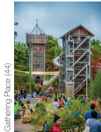
Gathering Place (44)

Text-Nachdruck kostenfrei, bitte mit Nennung des Herstellers. Vielen Dank für einen Veröffentlichungsbeleg.