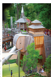
Gathering Place (19)