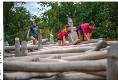
Gathering Place (30)