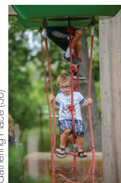
Gathering Place (36)