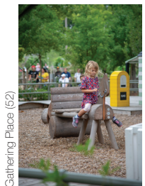
Gathering Place (52)