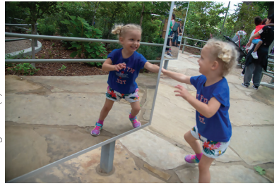
Gathering Place (2)