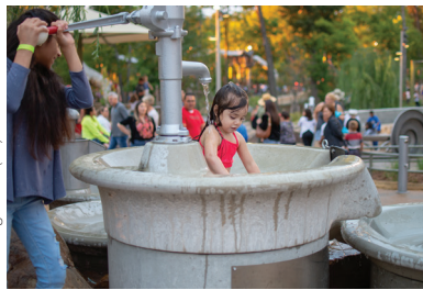
Gathering Place (25)