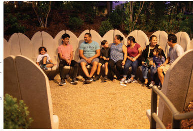
Gathering Place (27)