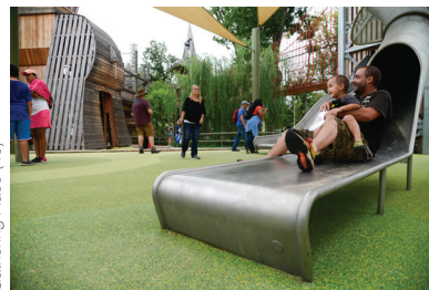
Gathering Place (49)