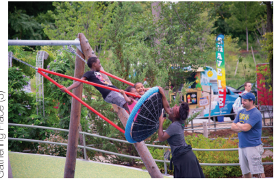
Gathering Place (3)