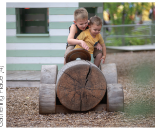
Gathering Place (4)