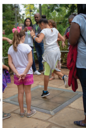
Gathering Place (9)