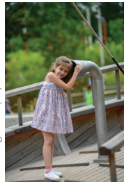
Gathering Place (50)