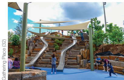
Gathering Place (32)