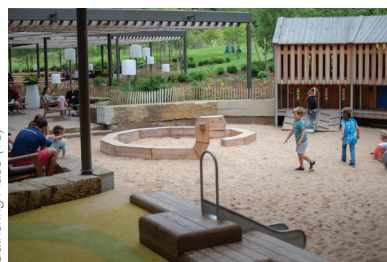
Gathering Place (13)