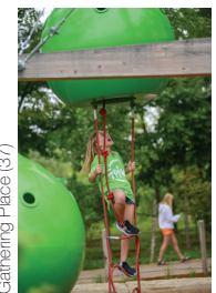
Gathering Place (37)