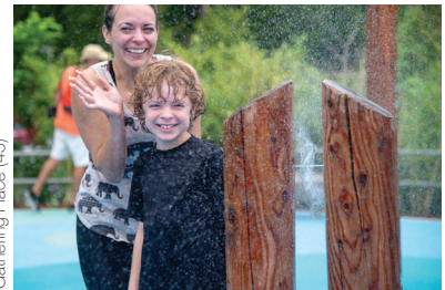
Gathering Place (45)