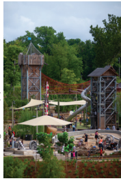
Gathering Place (7)