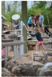
Gathering Place (48)