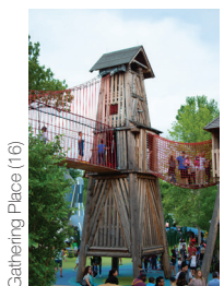
Gathering Place (16)