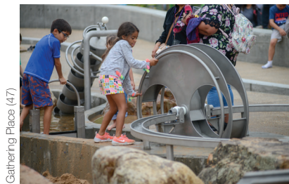
Gathering Place (47)