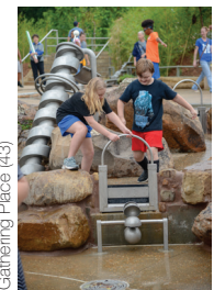
Gathering Place (43)