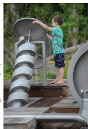
Gathering Place (46)