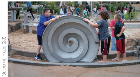
Gathering Place (23)