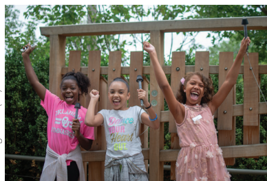
Gathering Place (11)