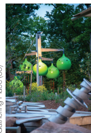
Gathering Place (35)