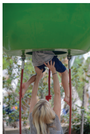
Gathering Place (38)