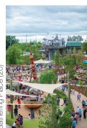
Gathering Place (20)