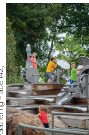
Gathering Place (42)