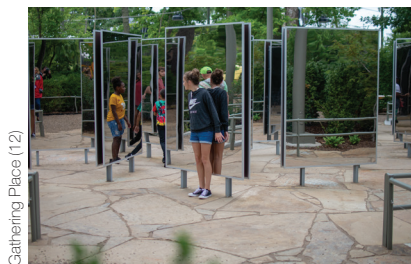
Gathering Place (12)