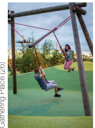
Gathering Place (26)