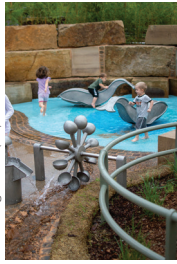
Gathering Place (24)