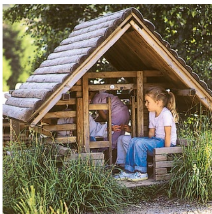
Best.-Nr. L4.10110 Kleines Spielhaus mit Tr

Kleines Spielhaus Kleines Spielhaus mit Tr Groes Spielhaus Groes Spielhaus mit Tr