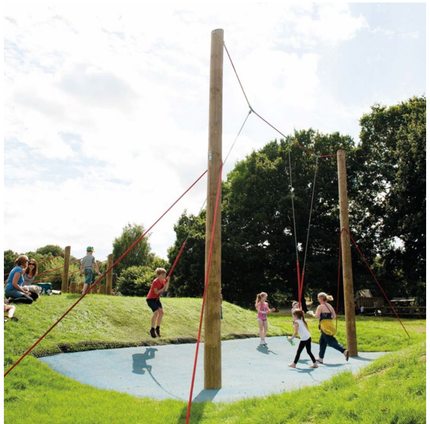
Das Foto zeigt abweichende Abspannseile

Bei der Verwendung von Hackschnitzeln als Fallschutz ist vor allem bei Einbeingeräten auf eine hohe Qualität mit wenig Rindenanteil zu achten. Die vorgeschriebenen Kontrollen der Standfestigkeit sind mit besonderer Sorgfalt bezüglich des Zustandes der Standpfosten und eventuellen Fäulnisschäden im unteren Stammbereich durchzuführen. Bitte beachten Sie dazu auch den Hinweis zur Verjährung der Frist für die Geltendmachung von Mängelansprüchen in unseren AGB.