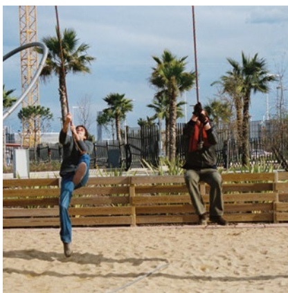
Best.-Nr. 7.65000 Schwingseilgerät